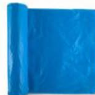
Alt: 150 cm Largo: 82 m